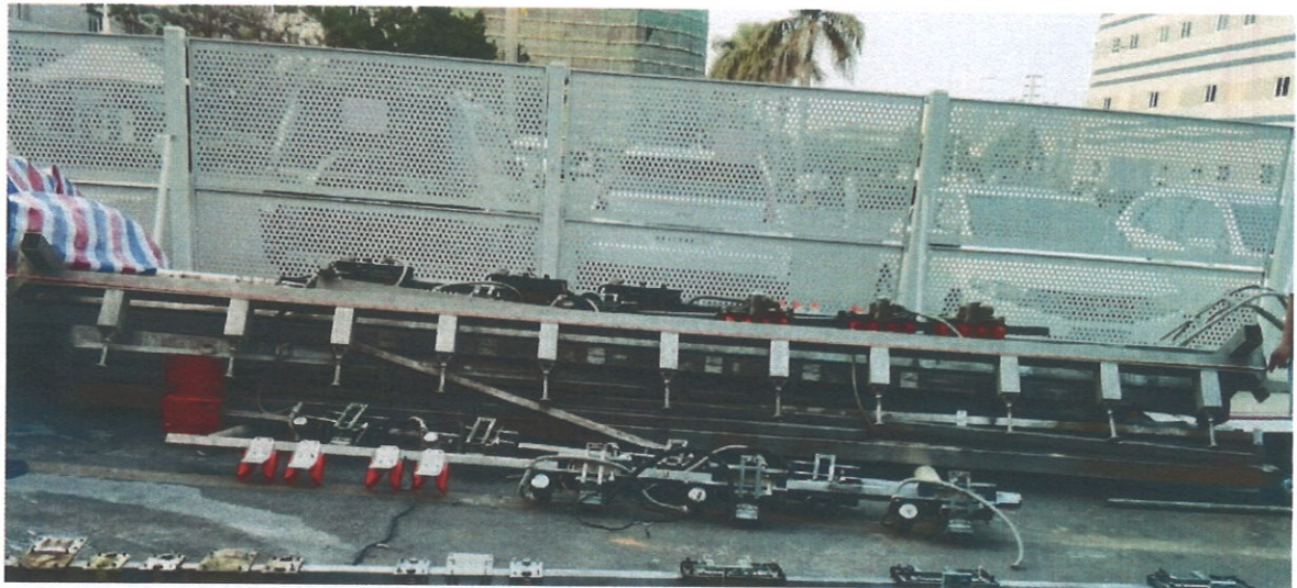
8、事发时吊运的长条状设备之一，长度为 6.25 米