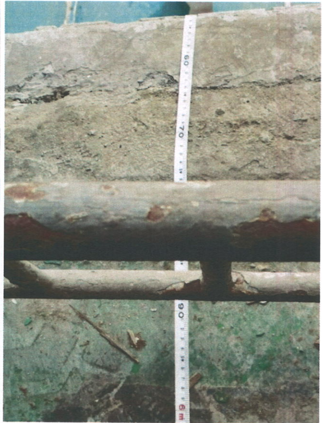
6、吊装口离地面高 5.54 米