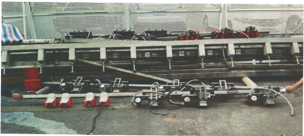
10、事发时吊运的长条状设备之一，长度为 3.78 米