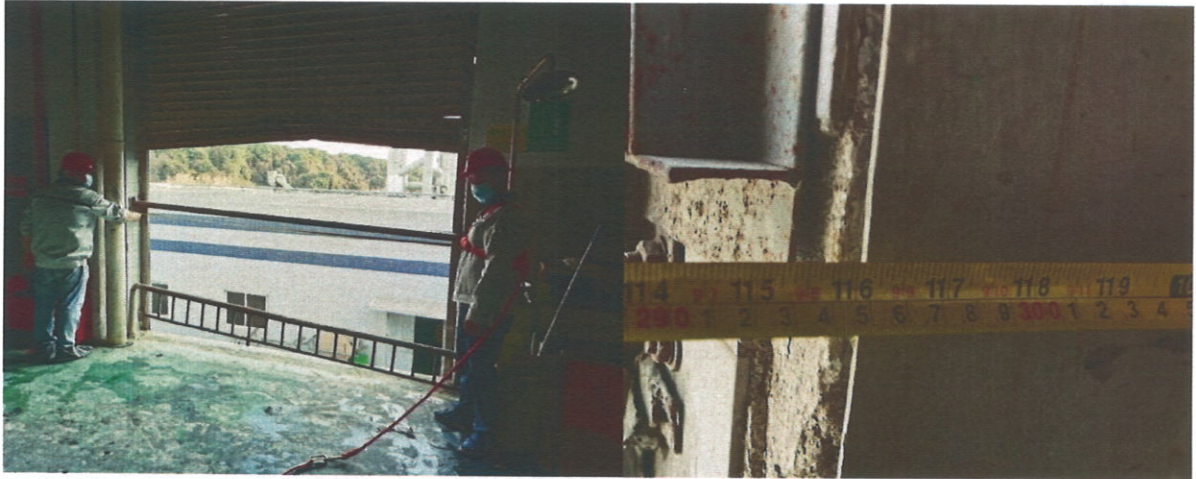
5、事发的吊装口宽 2.95 米