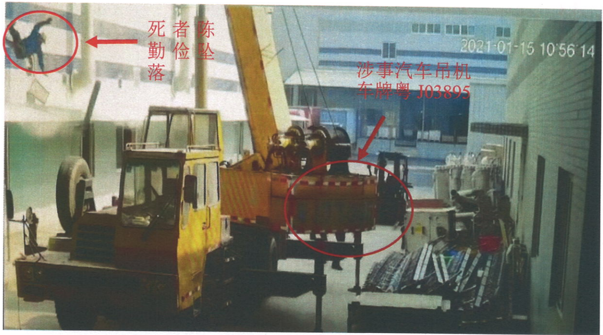
7、事发时的现场视频截图