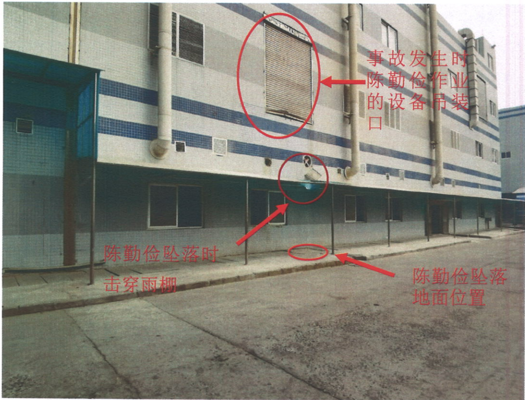
1、事故发生所在的世茂公司电镀车间二楼外墙开设的吊装口