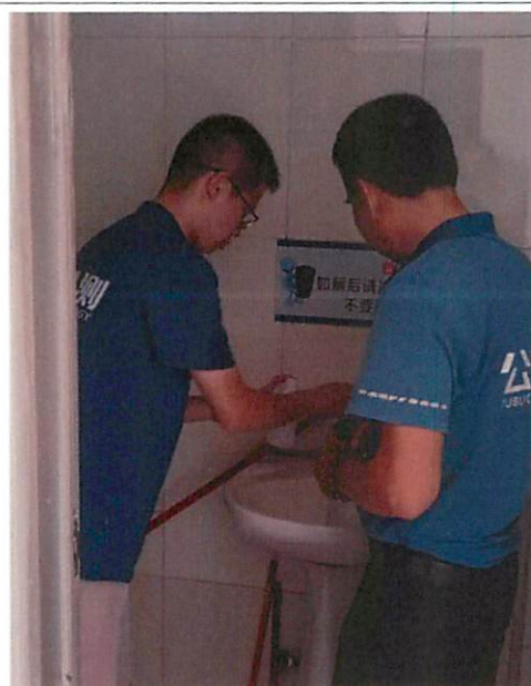
图 2：汇源村社区党群服务中心采样口