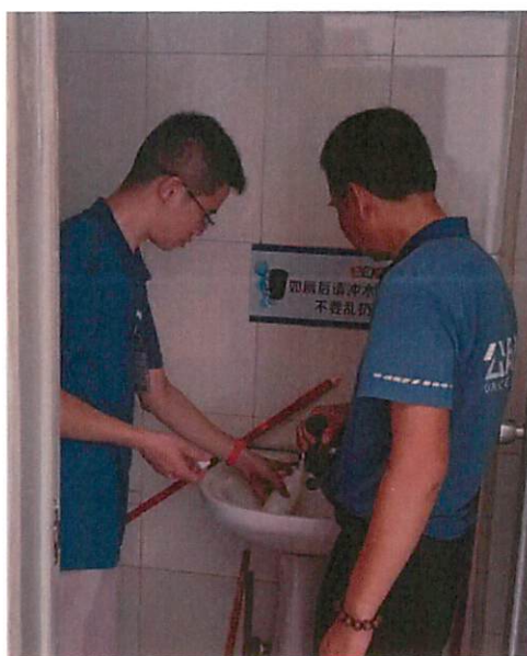
图 1：汇源村社区党群服务中心采样口