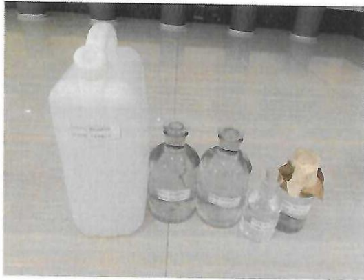
古劳龙溪小学样品