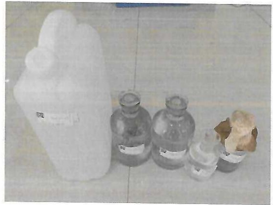
古劳龙溪小学样品