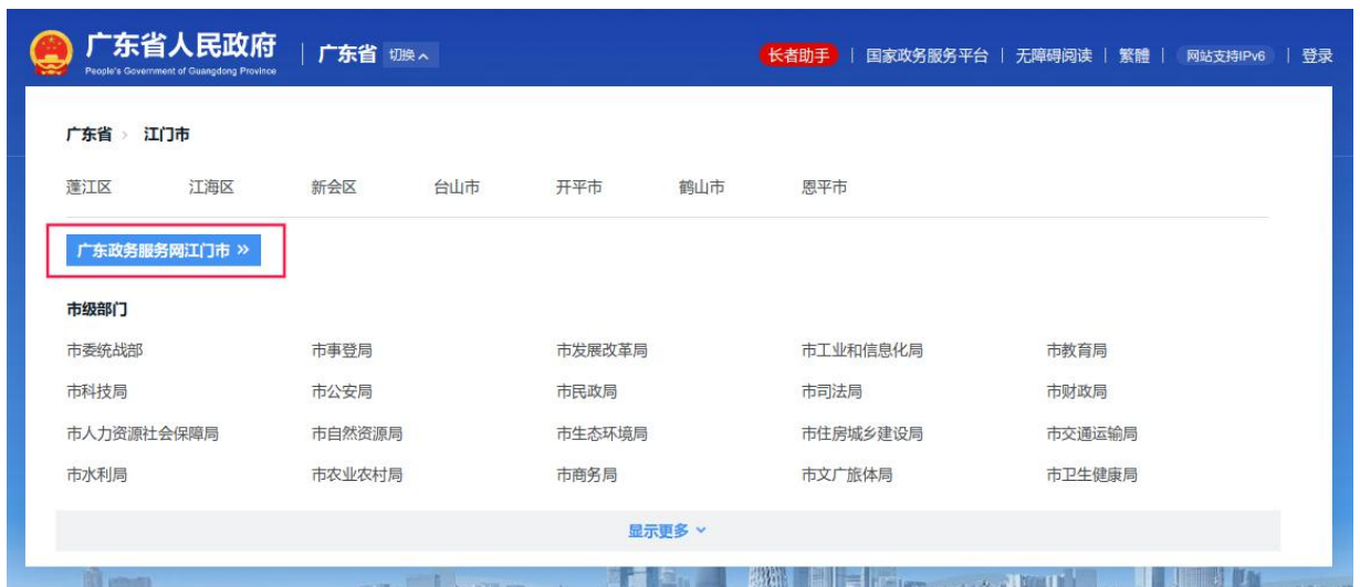
③进入“江门市政务服务网”